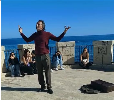
Torrione di Ortigia