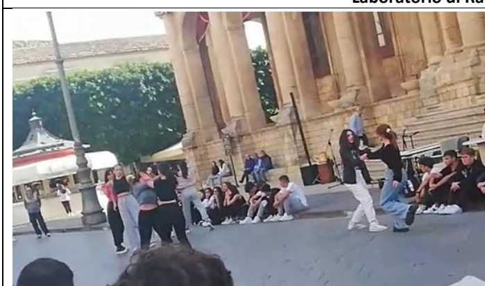
Laboratorio di Movimento espressivo