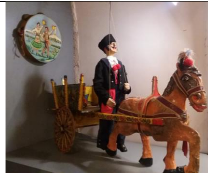
Il Museo Aretuseo dei pupi

La mattina del 9 novembre l'attenzione si è spostata sul sito archeologico di Lentini, dove i giovani hanno potuto ammirare i resti della città di origine greca che ha dato i natali a Gorgia, uno dei maggiori esponenti della Sofistica. Hanno anche visitato la Grotta di San Mauro in cui dimorava una comunità eremitica.