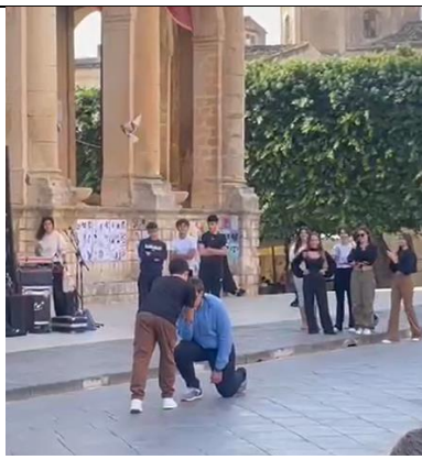
Laboratorio di Teatro