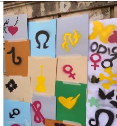
Laboratorio di Street art