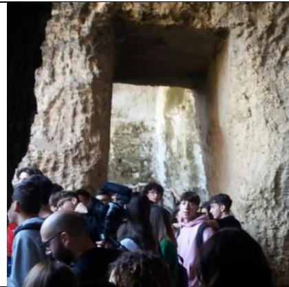
Grotta San Mauro