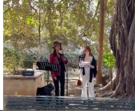
Lungomare di Ortigia a Siracusa