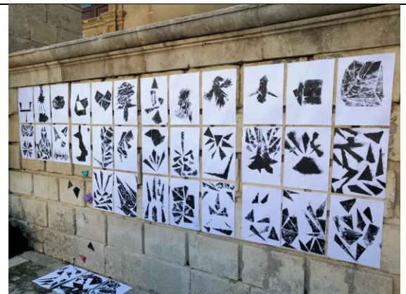
Laboratorio di Fantasiologia