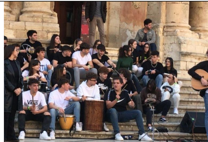
Laboratorio di Musica