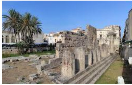
Punto d'incontro: Tempio di Apollo