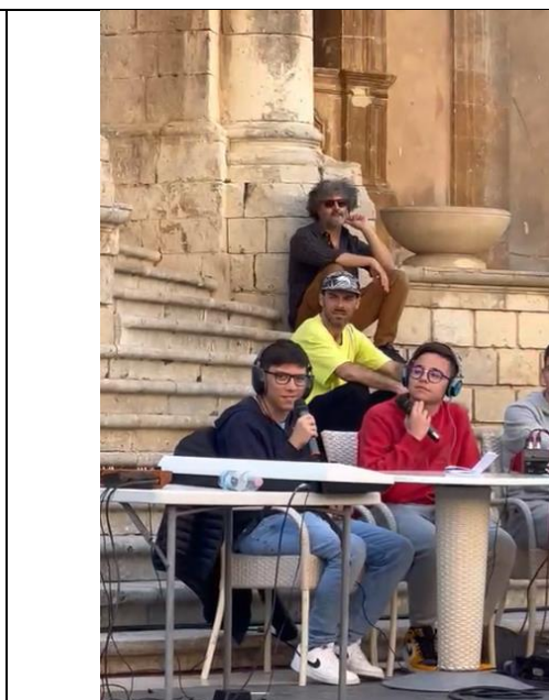
Laboratorio di Radiosofia