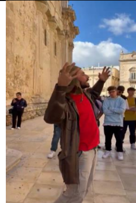
Cattedrale della Natività di Maria Santissima

La Passeggiata è proseguita con la visita alla Cattedrale Metropolitana della Natività di Maria Santissima situata sulla parte elevata dell'isola di Ortigia. La sua particolarità consiste nel fatto che sono ancora visibili i resti delle colonne in stile dorico di un tempio dedicato ad Atena (Minerva), divenuto successivamente una chiesa cristiana. Infine, i giovani liceali sono stati accolti presso il Museo Aretuseo dei pupi siracusani custodito dalla famiglia Vaccaro-Mauceri.