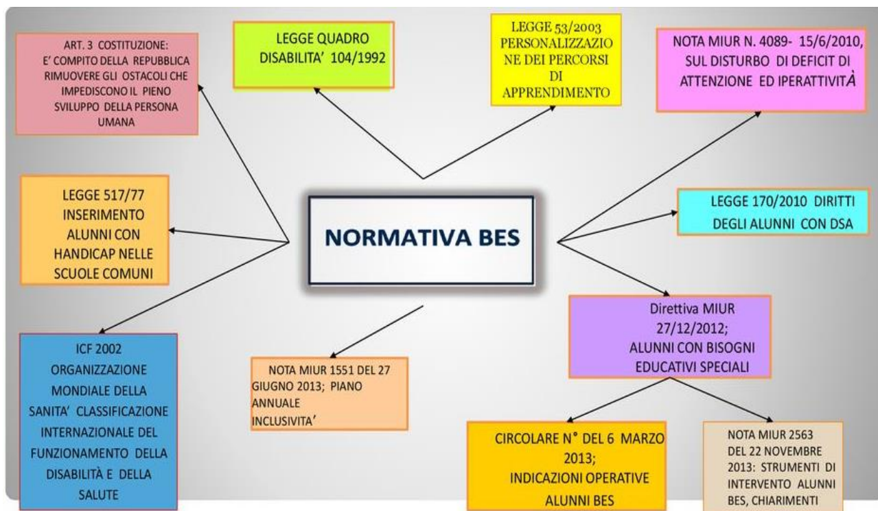
Tabella riassuntiva n.4

Documento redatto dal Dipartimento Inclusione