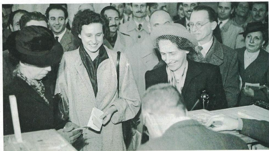
Donne italiane al voto per la prima volta, in occasione del referendum istituzionale del 2 giugno 1946.

Il cammino per l'affermazione di queste istituzioni fu però ancora lungo. Nella prima metà dell'Ottocento in molti Paesi europei iniziò a diffondersi l'idea che la legge non scaturisce più dalla volontà del re, ma dalla Carta costituzionale , che diventa la legge fondamentale dello Stato e riconosce le principali libertà civili e politiche dei cittadini. Per esempio, in Italia, lo Statuto albertino , concesso dal re piemontese Carlo Alberto nel 1848 ed esteso al Regno d'Italia nel 1861.